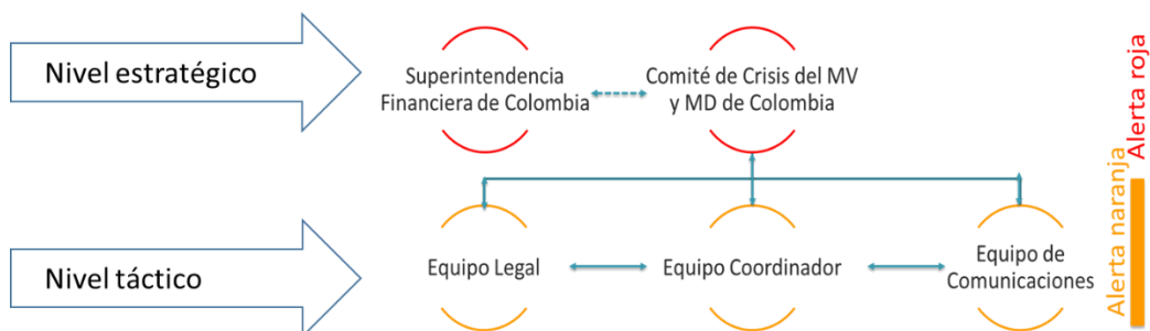
Gráfico 1 - Estructura de Gobierno

En los órganos de gobierno participan los funcionarios designados por cada uno de los proveedores de infraestructura que son parte de este Protocolo. Según lo estimen necesario o conveniente, los órganos de gobierno del Protocolo podrán invitar a personas externas, asesores, o representantes de terceros, incluyendo los MAPs.